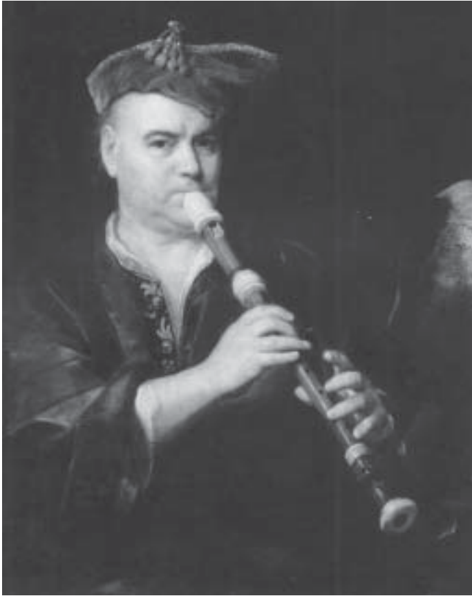
Jan Kupecky (1667?-1740) „Der Flötenspieler“