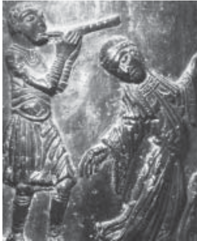
Zeigt diese Darstellung auf der „Bernwards-Säule“ (um 1020) eine Blockflöte? [3]

Eine Abbildung auf der „Bernwards Säule“ (einer Bronzeplastik) im Hildesheimer Dom - entstanden ca. 1020 unserer Zeit. - stellt unter an-